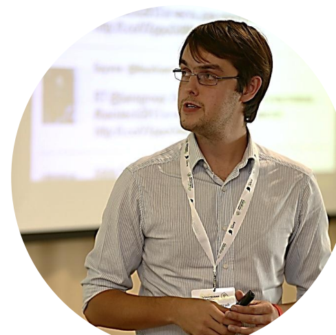
участие в качестве спикера